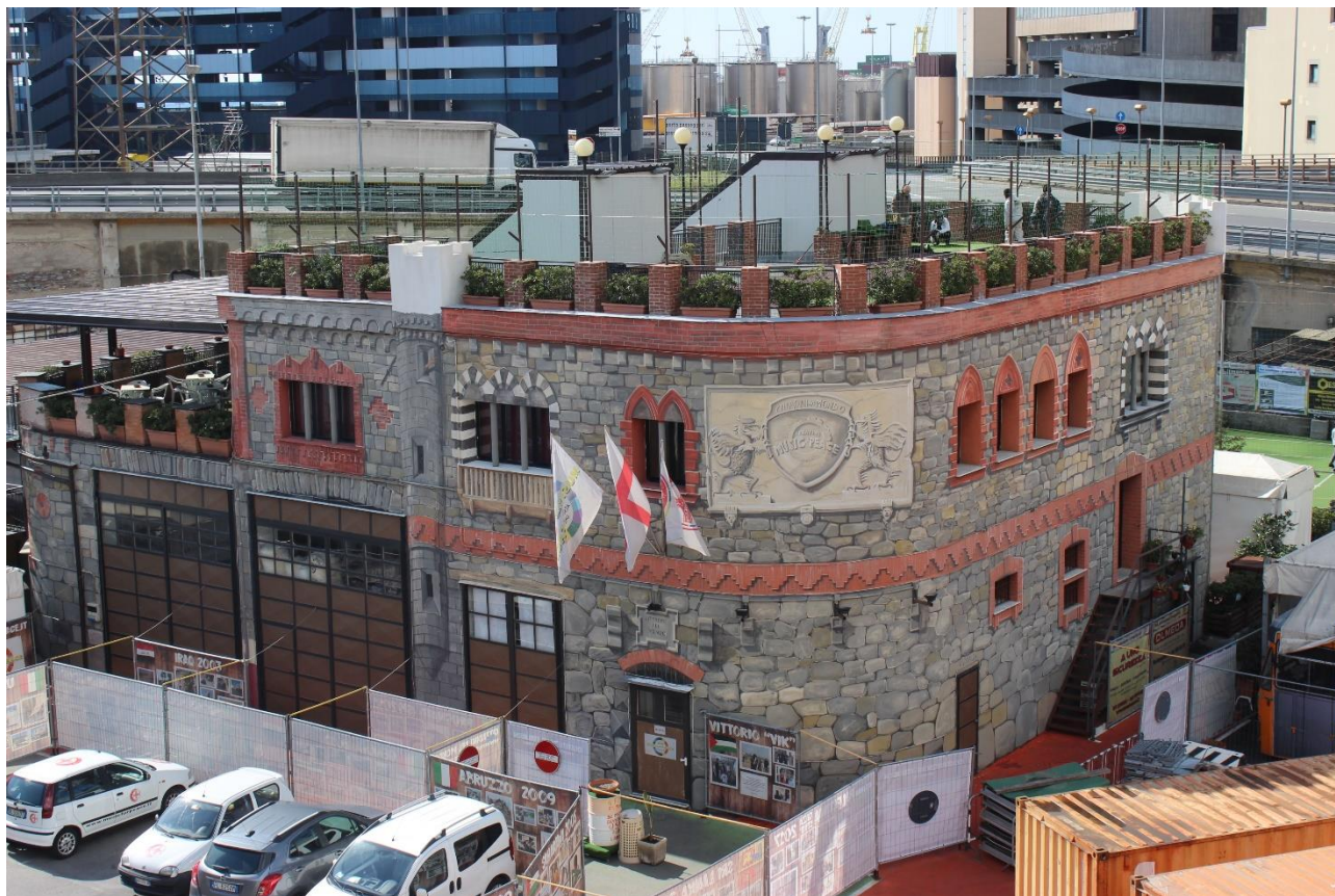
La sede di Music for Peace a Marzo 2018