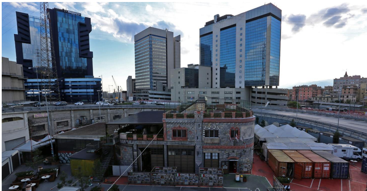
La sede di Music for Peace a Marzo 2019

Il Tesoriere il quale regola la tenuta dei libri contabili dell'Associazione, compila bilanci e consuntivi.